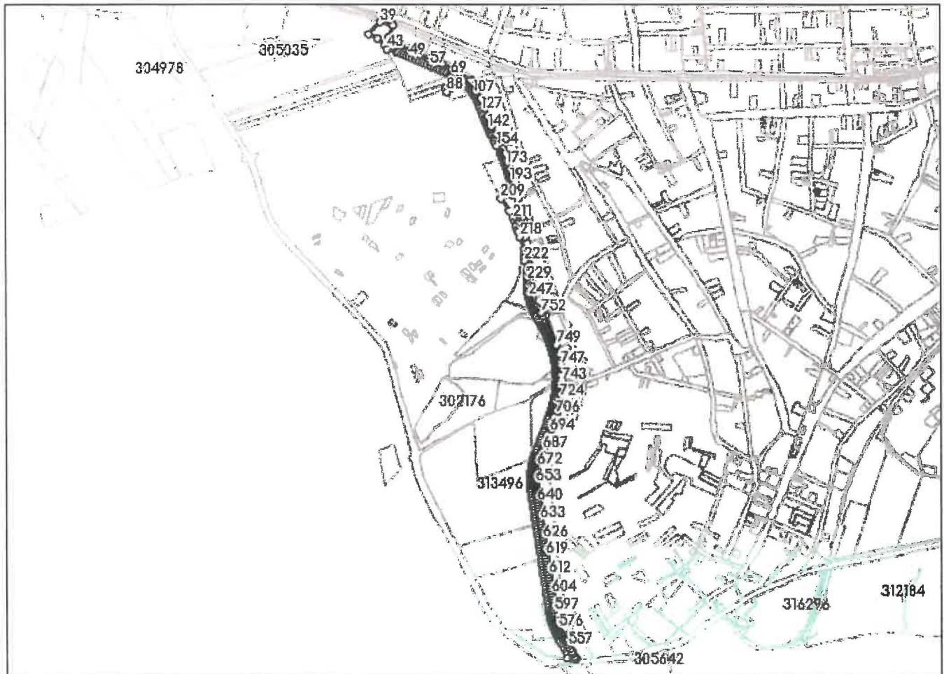
DETALII LINIARE IMOBIL

* Suprafața este determinată în planul de proiecție Stereo 70.