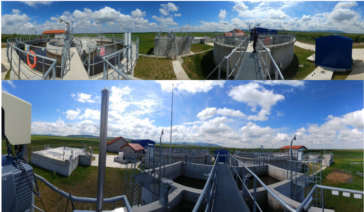
Stație de Epurare Păuliș