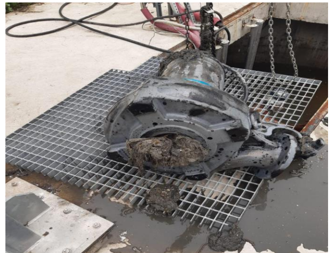
Intervenții ale Departamentului Mentenanță în cazul ploilor torențiale

Compania de Apă Arad a intervenit în perioadele de avertizări meteo cu toate echipele și utilajele din dotare pentru limitarea efectelor furtunilor. Cantitatea mare de precipitații căzută în timp scurt a făcut însă ca intervențiile să se desfășoare cu dificultate.